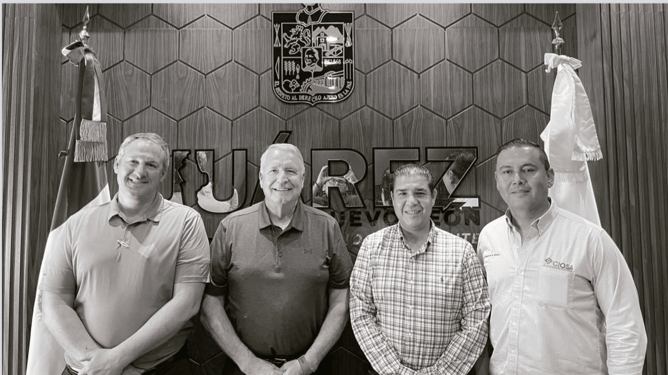
Francisco Treviño Cantú Alcalde de Juárez y directivos de la empresa CIOSA.

Con este tipo de acciones de gestión, Paco Treviño se consolida como alcalde, no solamente en la atención a los habitantes del municipio, en el mantenimiento y reparación de calles y avenidas, así como en brindar seguridad a la gente, sino que también asegura el crecimiento económico al generar inversión y empleo para las familias juarenses.